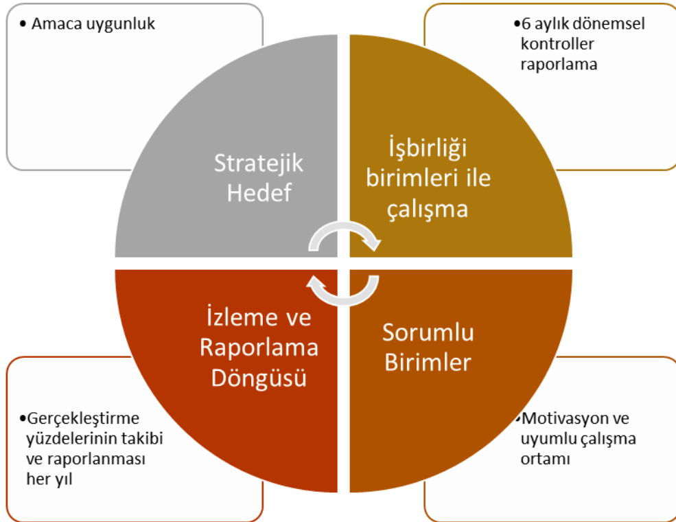
Şekil-9. Stratejik Plan İzleme-Değerlendirme Modeli

Amaç ve hedeflere ulaşmada sadece stratejik plandan sorumlu birimlerin değil, Başiskele Selim Yürekten Mesleki ve Teknik Anadolu Lisesi Stratejik Plan Geliştirme Ekibi, okul veli ve tüm iç ve dış paydaşlarıyla birlikte; üst yönetimin de desteğini alarak, temel değerleri doğrultusunda kalite ve başarı bilincini kurum kültürü olarak benimseyerek 2019-2023 Stratejik Planı başarı ile uygulanacaktır.